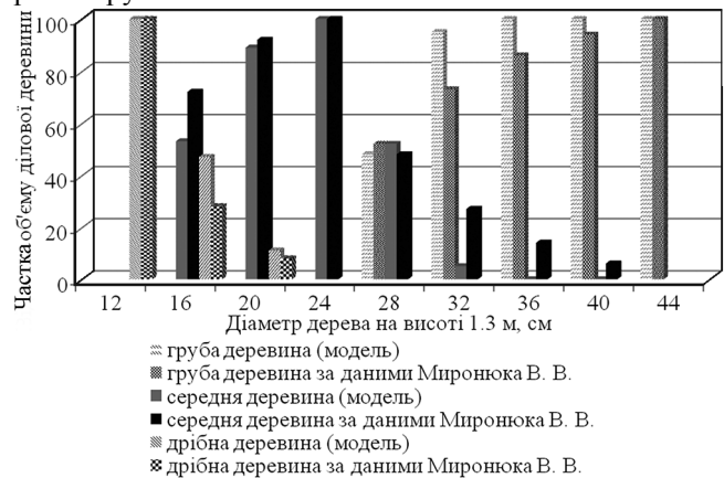
Рис. 3. Залежність частки ділової деревини стовбурів дерев гіркокаштана звичайного та кленів ясенелистого та сріблястого за крупністю

На рис. 3 графічно проілюстровано порівняльний розподіл об'єму стовбурів за розмірно-якісними категоріями крупністю.