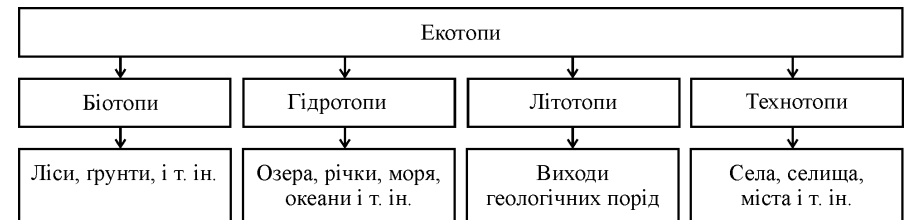
Рис. 2. Класифікація екосистем за типом (систематизовано на основі [3])

Складність класифікації об'єктів за їх розміром полягає в тому, що за допомогою одних і тих самих критеріїв потрібно оцінити екосистему, яка утворюється мінімальною неподільною одиницею (окремим організмом, краплею води), та всю нашу планету загалом. Згідно з рис. 1, лісові екосистеми входять до складу макросистем, оскільки ліси займають значну ділянку території. Для України показник лісистості становить майже 16 % [4], що свідчить про велике значення лісових екосистем у збалансованому розвитку країни.