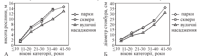
Рис. 2. Морфометричні показники стовбура Picea pungens Engelm. залежно від віку в міських насадженнях різних типів

Важливим показником умов, в яких зростають дерева, є їх морфометричні параметри (висота рослини та діаметр стовбура). Визначено, що в насадженнях досліджуваних промислових міст висота дерев Picea pungens у віці до 10 років змінюється від 1,2 м – у парках до 1,6 м – у скверах (рис. 2, А). Згодом дерева, що ростуть на вулицях вздовж доріг починають відставати у рості. З досягненням дерев віку 11-20 років середня висота їх становить 5,1^{±0,74} м, тоді як дерева у парках і скверах досягають висоти 6,8^{±0,61} м та 7,0^{±0,60} м відповідно. Таку закономірність встановлено для дерев усіх вікових категорій. Оцінюючи достовірність відмінностей висоти дерев між різними типами насаджень, з'ясовано, що рослини, які зростають у парках і скверах у віковій категорії 11-20 років, мають значення ймовірності 0,228, що за рівня значимості ( p=0,05 ) свідчить про недостовірність відмінності між цими групами (табл. 2). У групах парки-вуличні насадження та сквери-вуличні насадження (11-20 років) значення ймовірності 0,037 та 0,030 відповідно, що підтверджує статистично достовірну відмінність між групами ( p=0,05 ) (див. табл. 2). Достовірну відмінність між цими групами підтверджено статистично для дерев інших вікових категорій.